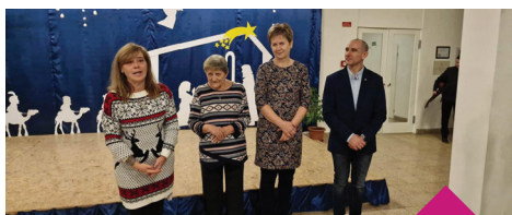
Karácsoonyi ünnepség 2022. december