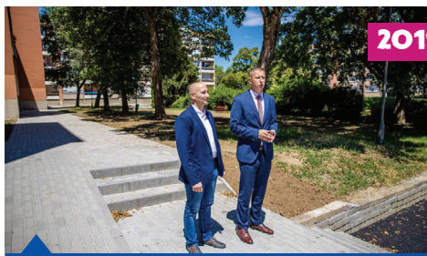
Járdafelújítás a Pázmány Péter krt. 42–52. tömbbelsőben