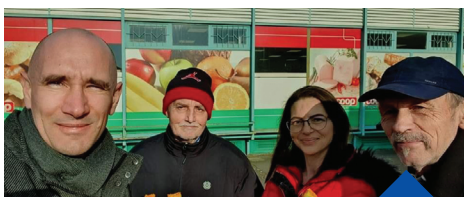
Nőnap virágosztás 2023. március