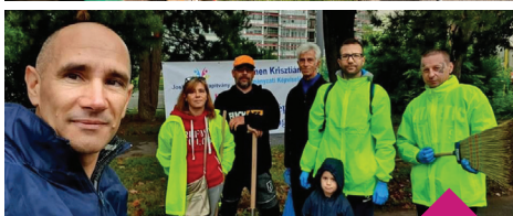
A Joskar-Ola megszépül program 2022. szeptember