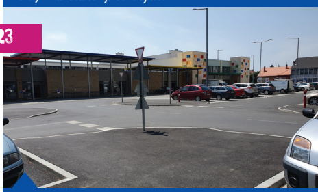
Vásárcsarnok környezetének a felújítása