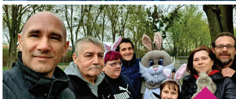
Csokinyuszikereső 2022. április