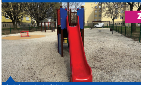
Barátság utcai játszótér felújítása