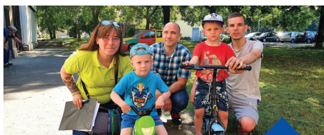
Kerékpáradományok 2021. június