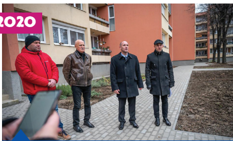
Járdafelújítás a Pázmány Péter krt. 54–64. tömbbelsőben