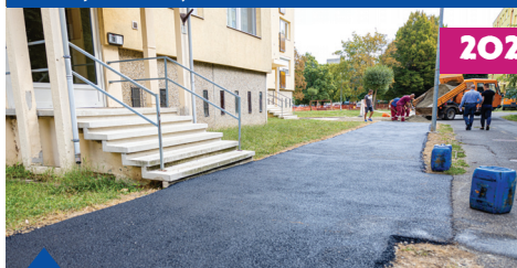
Járdafelújítás a Barátság utcában