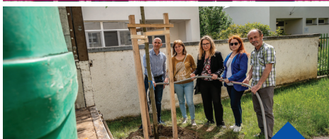
Szombathelyi Távhőszolgáltató Kft.-vel faültetés 2022. június