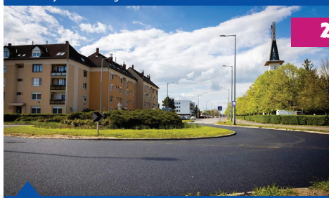
Hunyadi út végén lévő körforgalom felújítása