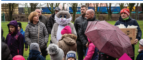
Csokinyuszi kereső 2023. április