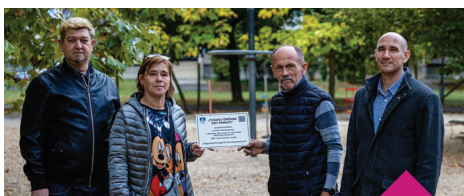
Fogadj örökre egy parkot 2021. október