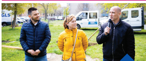
Közösségi faültetés 2023. április