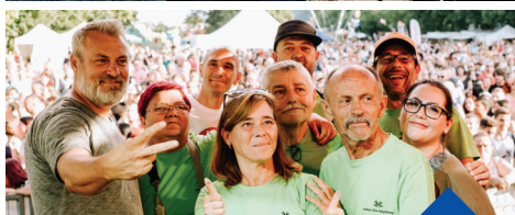
XXII Joskar-Ola Napok 2022. augusztus