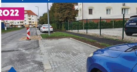
Parkoló kialakítások a Gyurits Antal utcában